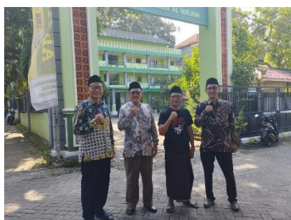
PP. Al Ikhlas Mulyorejo Delegan Panceng