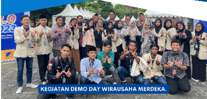
KEGIATAN DEMO DAY WIRAUSAHA MERDEKA.