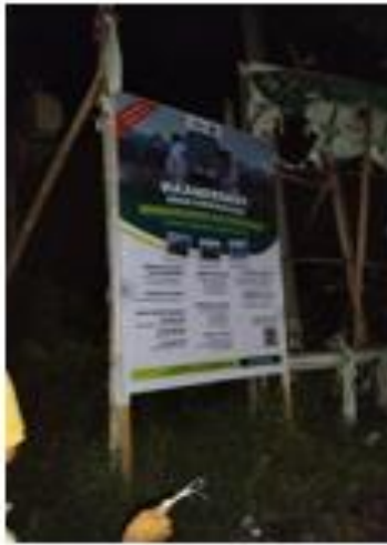
ALUN ALUN BALONG PANGGANG