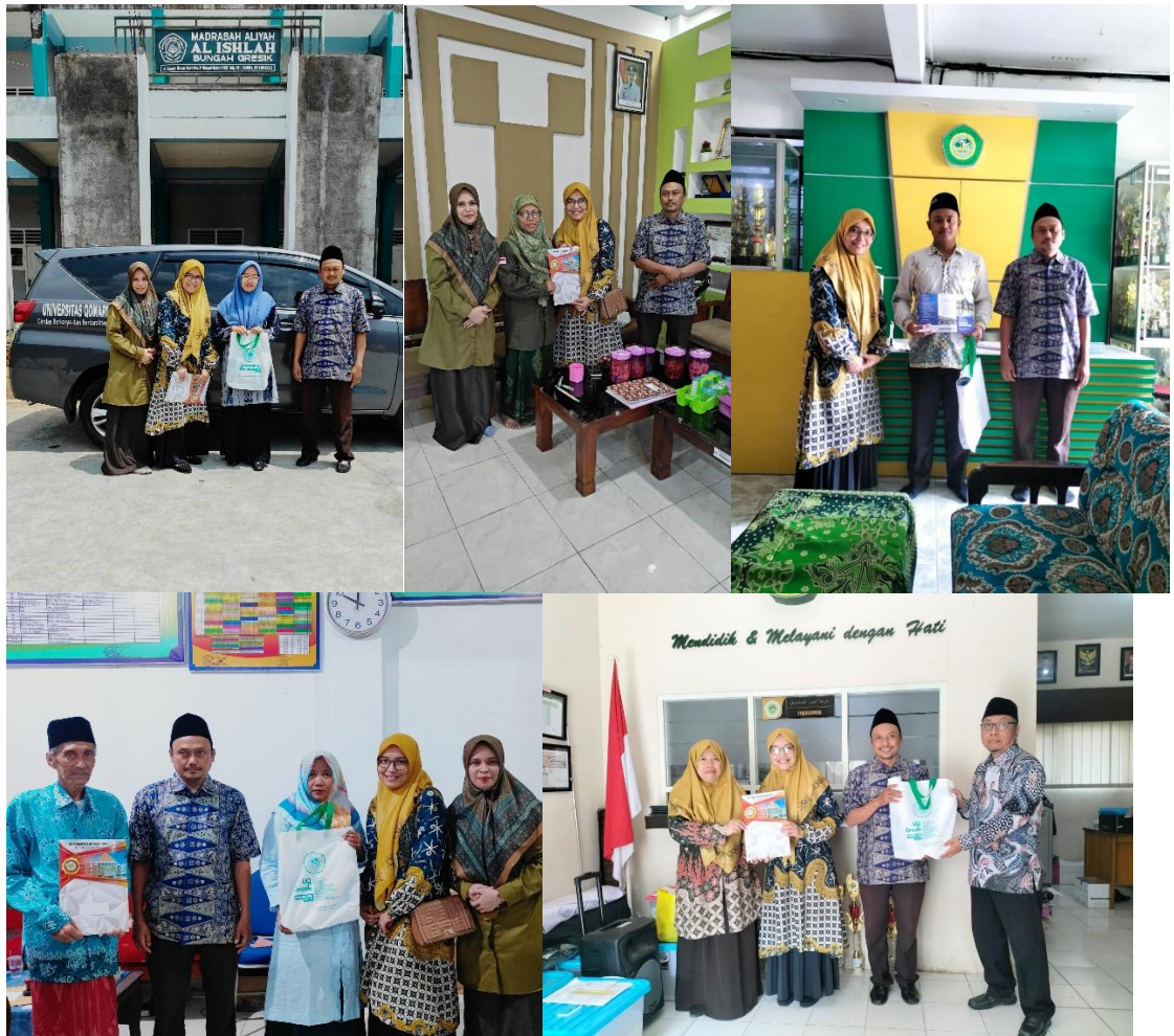
8. Kunjungan ke MA MAMBAUL ULUM MOJOPURO, SMK MIFTAHUL ULUM, MA MAMBAUL ULUM BEDANTEN, SMK NURUL HIDAYAH dan SMA NUSANTARA Kecamatan Bungah, Senin 18 Februari 2024