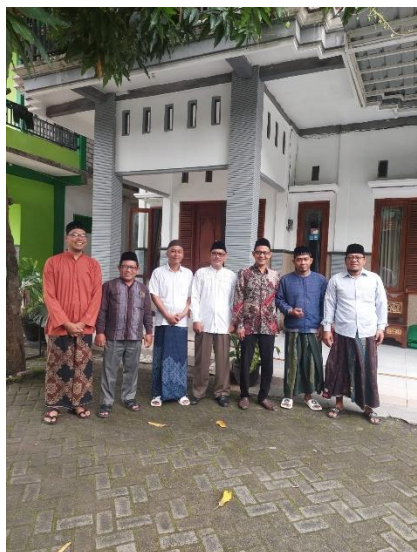
PP. Al Karimi Tebuwung Dukun