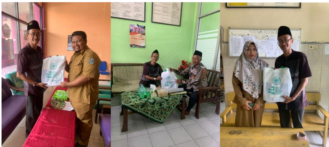
7. Kunjungan ke SMK ASSA'ADAH, SMA ASSAADAH, MA ASSAADAH, SMK MUHAMMADIYAH 1 GRESIK, MA Hasyimiyah Mengare dan MA AL ISLAH Kecamatan Bungah, Rabu 14 Februari 2024