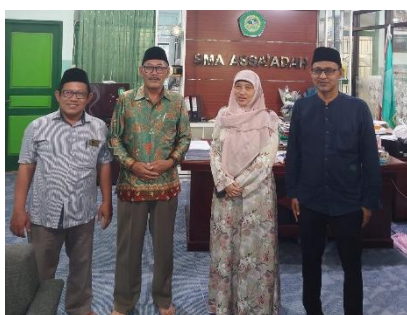
Kepala Sekolah SMA Assa'adah