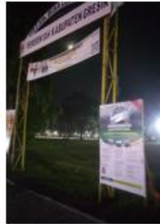
ALUN ALUN SEDAYU