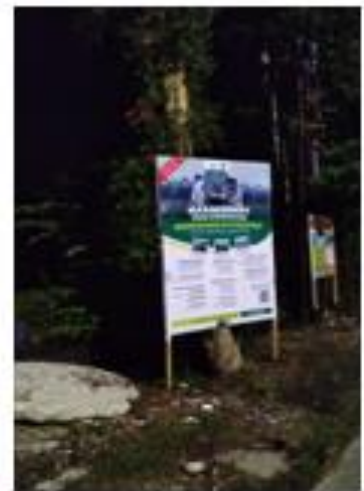
BENJENG ARAH BOBOH