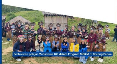
Pertukaran pelajar Mahasiswa UQ dalam Program MBKM di Sorong Papua