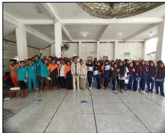
26. Kegiatan Expo di Manu Petung Panceng pada tanggal 08 Februari 2025