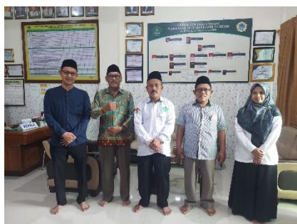
Kepala Sekolah MAN 1 Gresik