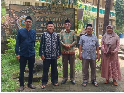
Kepala sekolah MA Assa'adah