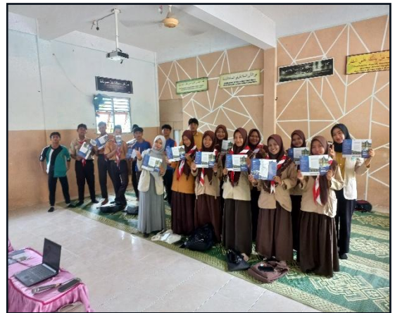
20. Kegiatan sosialisasi di MA Al Islah Bungah pada tanggal 05 Februari 2025