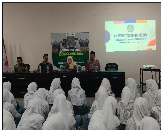
29. Kegiatan sosialisasi di SMKN 1 Sidayu pada tanggal 24 April 2025