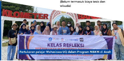
Pertukaran pelajar Mahasiswa UQ dalam Program MBKM di Aceh