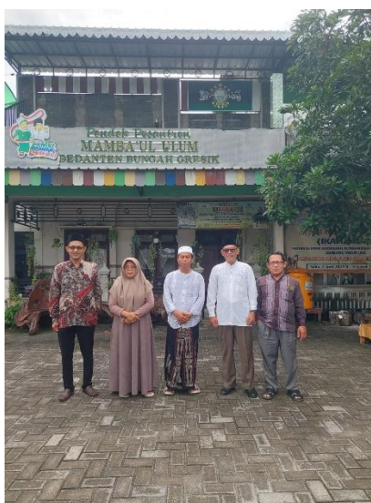
PP. Mambaul Ulum Bedanten