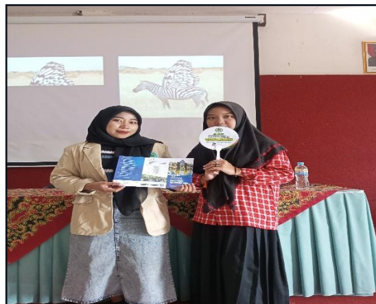
23. Kegiatan sosialisasi di MA Al- Muniroh pada tanggal 06 Februari 2025