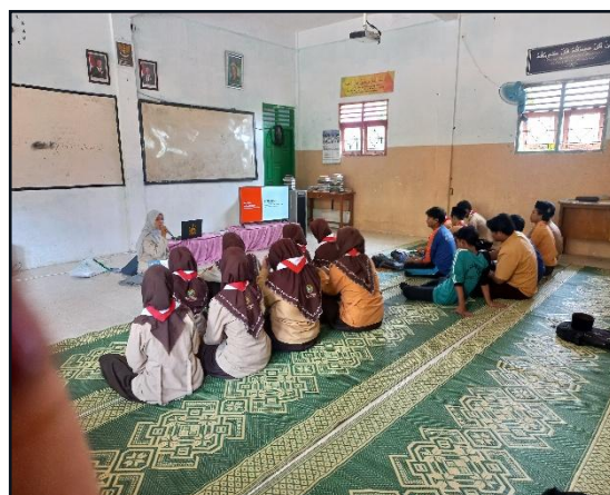
24. Kegiatan sosialisasi di SMK Wahid Hasyim 08 Februari 2025