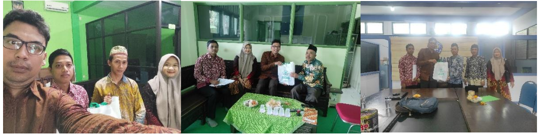
5. Kunjungan ke SMK YASMU, SMK NURUL ISLAM, dan SMK PGRI Kecamatan Manyar dan Gresik, Senin 12 Februari 2024