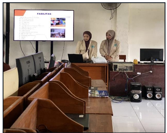
21. Kegiatan sosialisasi di SMA Bahrul Ulum Sekapuk pada tanggal 06 Februari 2025