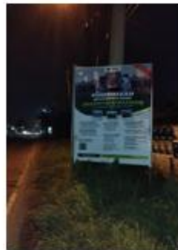
MENGANTI AL AZHAR