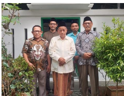
PP. Al Muniroh Ujungpangkah