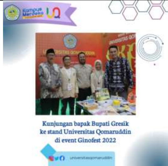
Kunjungan bapak Bupati Gresik ke stand Universitas Qomaruddin di event Ginofest 2022