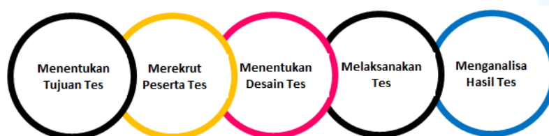
Gambar 3: Tahapan remote usability test

Tahap kedua merupakan tahap uji kelayakan produk berupa Web-based materials yang telah dikembangkan berdasarkan analisa kebutuhan. Ada beberapa tahap dalam uji kelayakan produk (Remote usability test) (18).