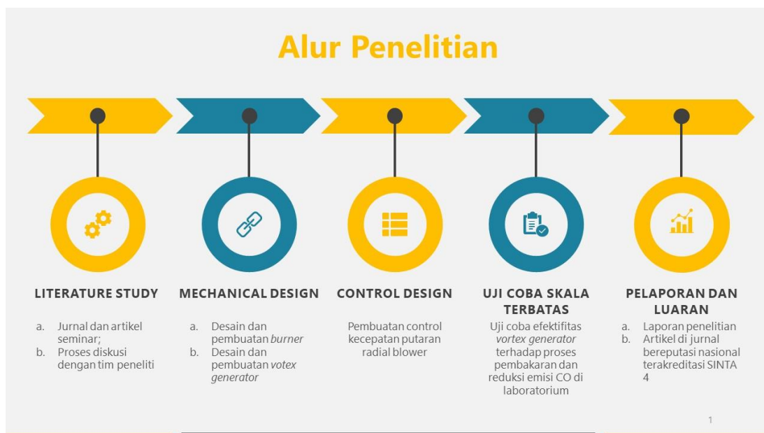
Gambar 3. Alur Penelitian

Berdasarkan ilustrasi desain burner yang telah digambarkan, dapat diperkirakan kebutuhan hardware yang digunakan dalam penelitian. Adapun kebutuhan hardware dituliskan sebagai berikut: (1) burner berbentuk silinder: baseline burner pellet fuel ; (2) vortex generators : optimalisasi heterogenitas bahan bakar dan udara sebelum terbakar; (3) data acquisition : untuk recording temperatur di chamber , flue gas , dan kadar emisi gas buang dengan tingkat ketelitian tinggi; (4) control system : mengatur kecepatan centrifugal compressor dengan kepresisian tinggi, dan (5) ruang laboratorium: pengembangan dan pengujian sistem.