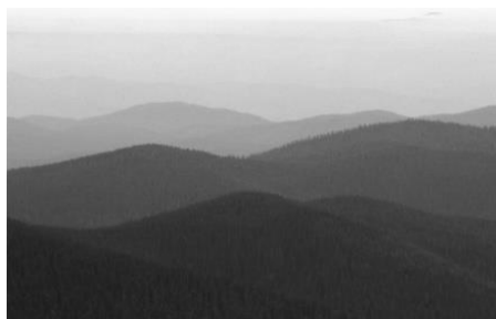
Gambar 1.1 Gunung Bromo